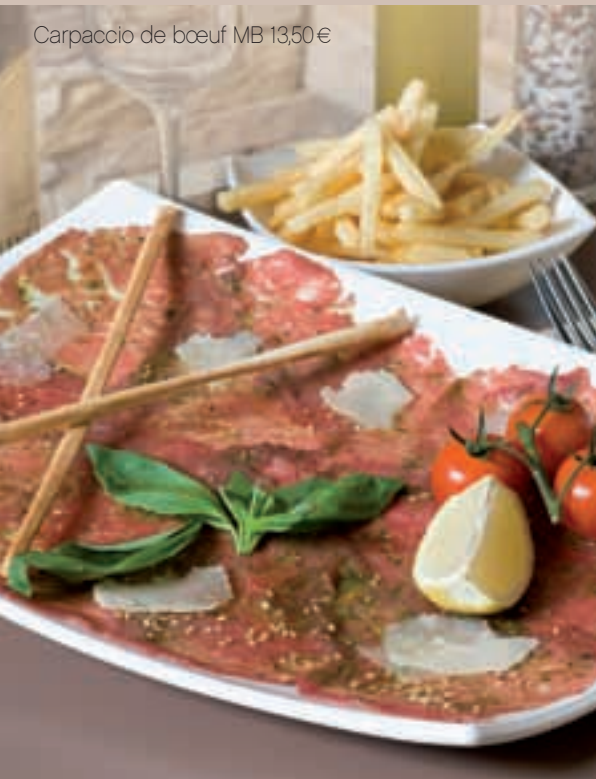
Carpaccio de boeuf MB 13,50€

Votre garniture au choix : frites ou salade