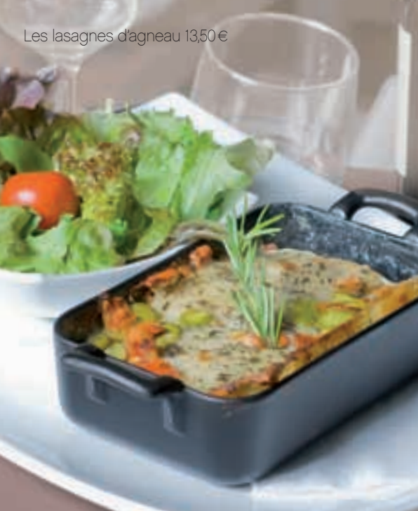
Les lasagnes d'agneau 13,50€