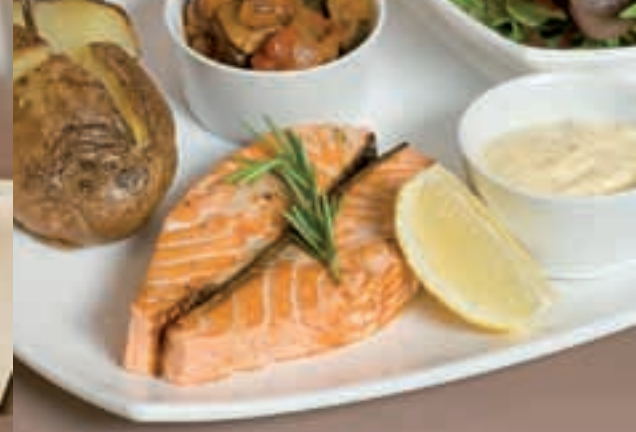
Le pavé de saumon 15,20€