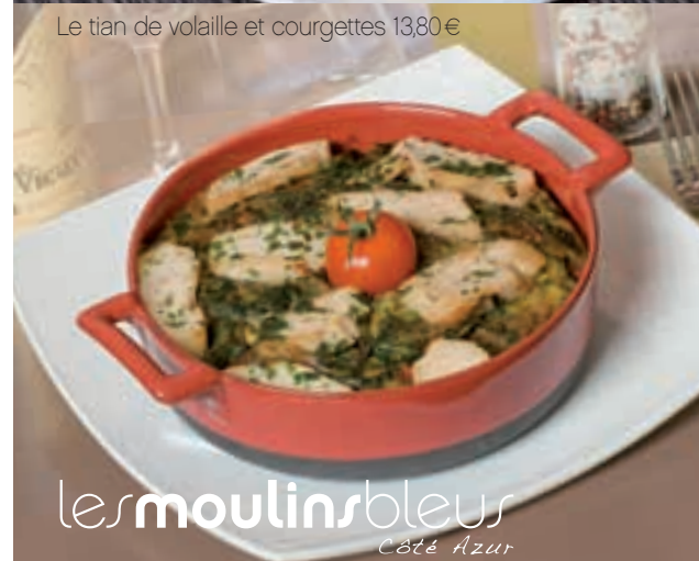
Le tian de volaille et courgettes 13,80€