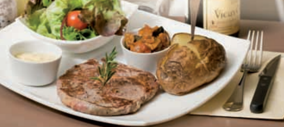
L'Entrecôte du Chef 15,90€