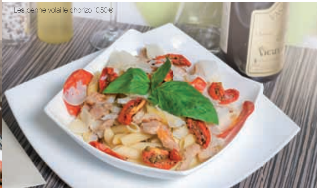
Les penne volaille chorizo 10,50€

Nos lasagnes sont accompagnées d'un mélange de salade et jeunes pousses.