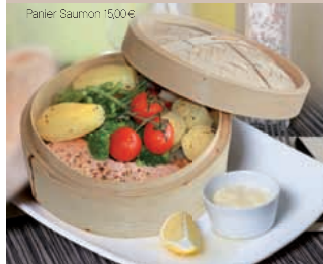
Panier Saumon 15,00€